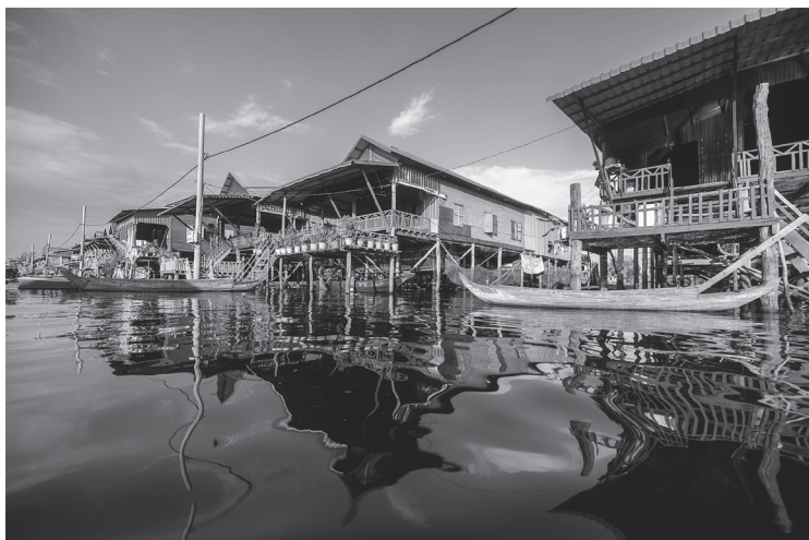
Плавающая деревня на озере Тонлесап в Камбодже

Древнейшим местным представлениям о духах земли, могущественных покровителях гор и моря здесь сопутствовали индуистские и буддийские влияния, пришедшие из Индии. Самым известным архитектурным памятником Камбоджи считается Ангкор-Ват — грандиозный храмовый ансамбль, посвященный Вишну и возведенный в первой половине XII века при правителе Сурьявармане II. Он иллюстрирует как удивительную одаренность зодчих того времени, так и характерный для Кхмерской империи синтез индуизма и буддизма.