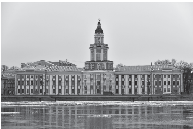
Музей антропологии и этнографии имени Петра Великого (Кунсткамера), Санкт-Петербург

В Юго-Восточной Азии насчитывается более десятка государств, и мифология каждого из них своеобразна и интересна. Однако в рамках этой книги будут рассмотрены лишь несколько наиболее показательных примеров: Камбоджа, Вьетнам, Мьянма, Индонезия, Таиланд и Филиппины. Выбор объясняется невозможностью объять необъятное и желанием показать самое яркое и характерное. Мифы этих стран позволяют получить полное и глубокое представление о богатом культурном наследии региона.