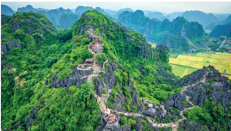
Гора Нгоа Лонг (Лежащий дракон) во Вьетнаме