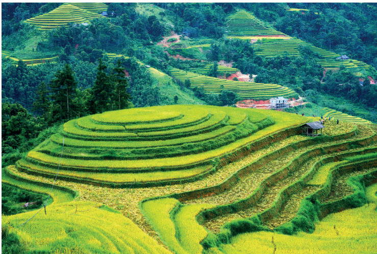
Рисовые террасы во Вьетнаме