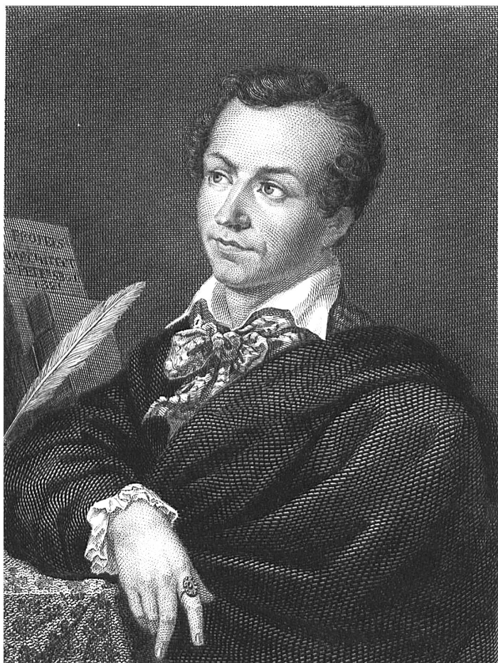
Мари-Антуан (Антуан) Карем (1783–1833), написан Чарльзом Штойбеном. Единственный известный портрет маслом, наиболее точно отражающий внешность повара