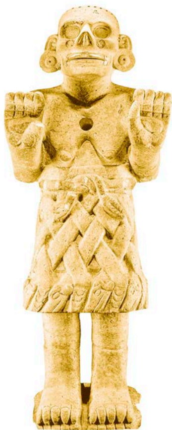
Коатликуэ. Ок. 1325–1521 гг. н. э.