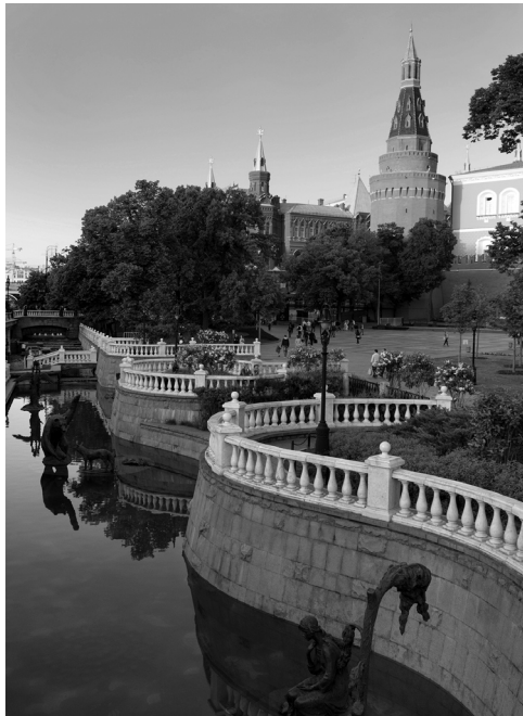
Александровский сад, вид на Московский Кремль

ся к многоголосому хору, который уже много веков звучит над густой сетью улиц Москвы и Подмосковья: в нем поют древние духи рек, шепчутся тени императоров и цареубийц, шумят моторы подземных призрачных поездов и хлопают двери современных небоскребов, построенных, возможно, на месте древних капищ. Мы не призываем вас воспринимать серьезно каждую представленную здесь историю. Но, согласитесь, бывает очень интересно узнать о том, что даже у самых диких городских страшилок иногда есть реальная историческая подоплека.