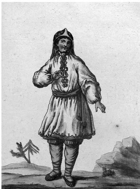
Ж. Грассе Сен-Совёр. Марийская женщина. 1797 г. Музей искусств Лос-Анджелеса

(создателях Вселенной), духах — хозяевах леса и воды, их ремесла и орнаменты имели общие корни.