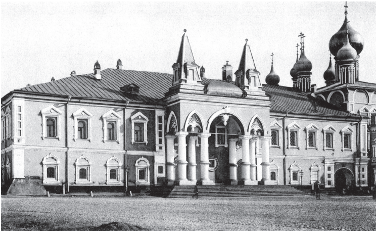
К. Фишер. Здания Чудова монастыря в Московском Кремле (не сохранились). Фото начала XX в.

Интересно, что в мире существует множество населенных пунктов с названием Москва. Лидируют Соединенные Штаты Америки — там их десятки. Также есть селение Moscow в Шотландии, основанное в па-