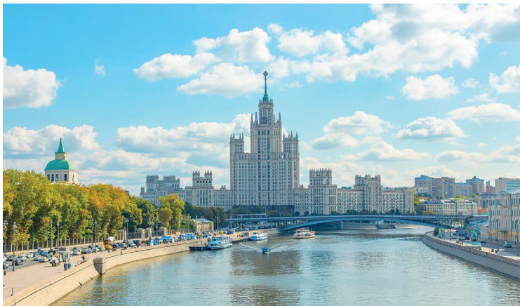
Москва-река и вид на жилой дом на Котельнической набережной