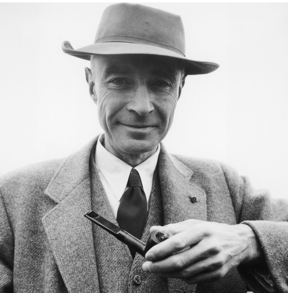
Роберт Оппенгеймер (фото 1958 года) — блистательный ученый, который был влюблен в культуру и гуманизм, но при этом стал творцом атомной бомбы