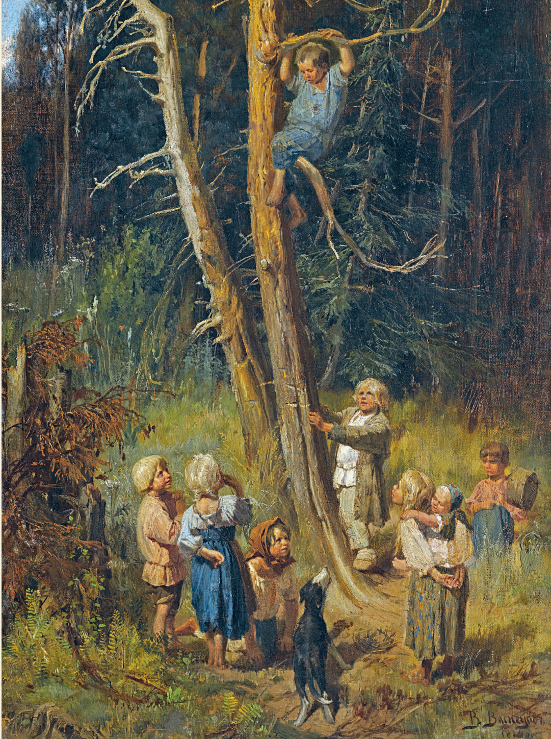
Виктор Васнецов. Дети в лесу (Дети разоряют гнезда. Птичьи враги). 1874. Частное собрание