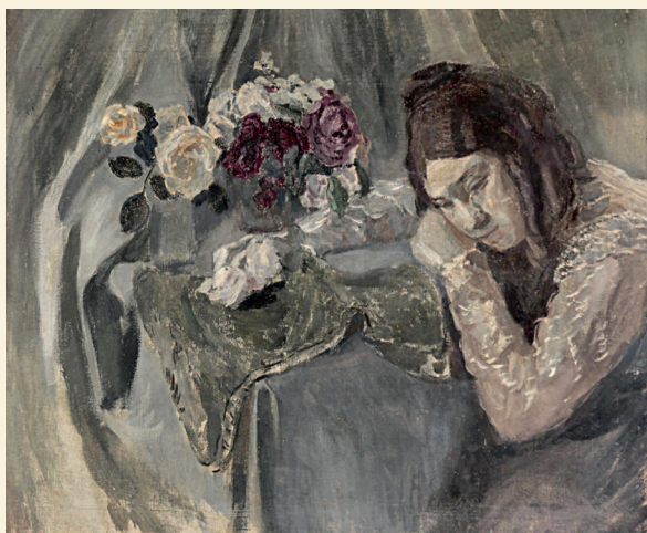
Виктор Борисов-Мусатов. Девушка с розами. Портрет сестры. 1902. Государственный музей искусств Казахстана имени А. Кастеева, Алма-Ата