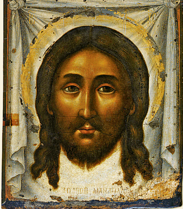
Симон Ушаков. Спас Нерукотворный. 1670-е. Частное собрание

изображений флоры и фауны в русском декоративном искусстве. Европейские влияния, связанные с Ренессансом и барокко, привнесли элементы натурализма, перспективы и кьяроскуро в русское искусство, способствуя развитию портрета, натюрморта и пейзажа. Таким образом, русские художники создали уникальный синтез восточных и западных традиций, положив начало особому русскому стилю, сочетающему сакральное и светское.