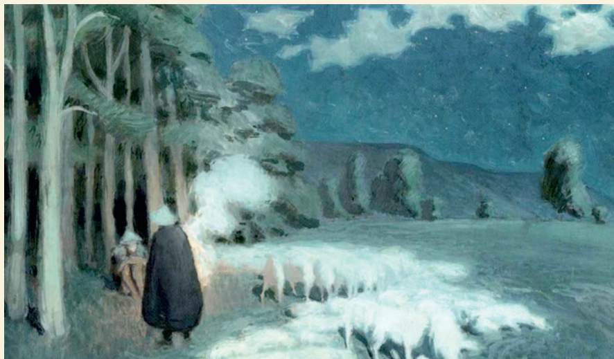
Виктор Борисов-Мусатов. Пастухи, пасущие стадо ночью. 1895. Частное собрание

Отличительными чертами модерна стали программная декоративность, плавность линий, витражное изображение фигур, орнаменты с растительными элементами и природные мотивы. Стиль формировался в России в русле национальных концепций, источниками вдохновения для художников служило народное творчество, сказки, фольклор. Излюбленными темами становятся сцены мифов, анималистика, повседневная жизнь. К мастерам