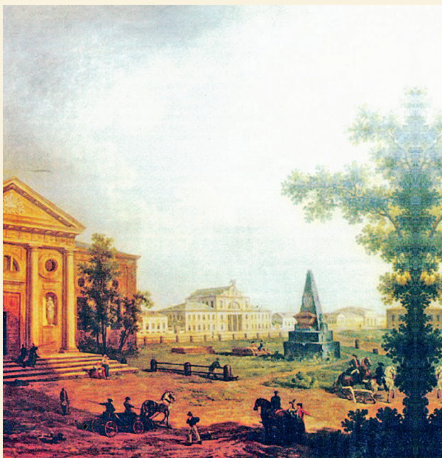
Федор Алексеев. Вид Херсона. 1797–1800. Херсонский областной краеведческий музей, Херсон

такие знаменитые мастера, как Владимир Боровиковский и Дмитрий Левицкий. «С уверенностью можно сказать лишь то, что одним из главных факторов, решивших судьбу русской живописи, было появление портрета», — писал Игорь Грабарь.