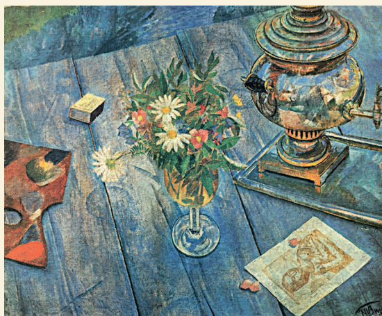
Кузьма Петров-Водкин. Натюрморт с самоваром. 1913. Национальная галерея Армении, Ереван

В XVII веке появились первые портреты, написанные в реалистическом стиле, с 1740-х годов более популярным становится камерный портрет. Известными портретистами были Алексей Антропов и Иван Аргунов, а в середине и конце XVIII столетия начинают творить