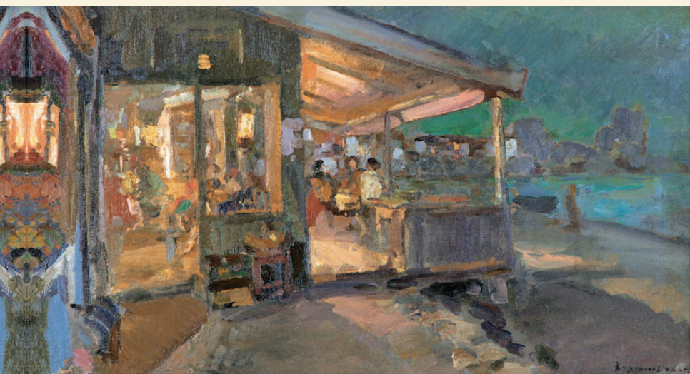
Константин Коровин. Чайная в Крыму. 1911. Эстонский художественный музей, Таллин