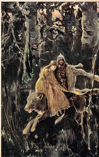
Виктор Васнецов. Иван Царевич. 1880. Харьковский художественный музей, Харьков

Первые живописные пейзажи появились в России во второй половине XVIII века, после того как в 1757 году в Петербурге открылась Императорская Академия художеств, устроенная по образцу европейских академий, где в числе других жанровых классов был открыт класс ландшафтной живописи, так как появился спрос на «снятие видов» памятных и архитектурно значимых мест. Основоположником пейзажного жанра стал Семен Щедрин, а городского пейзажа — живописец Федор Алексеев.