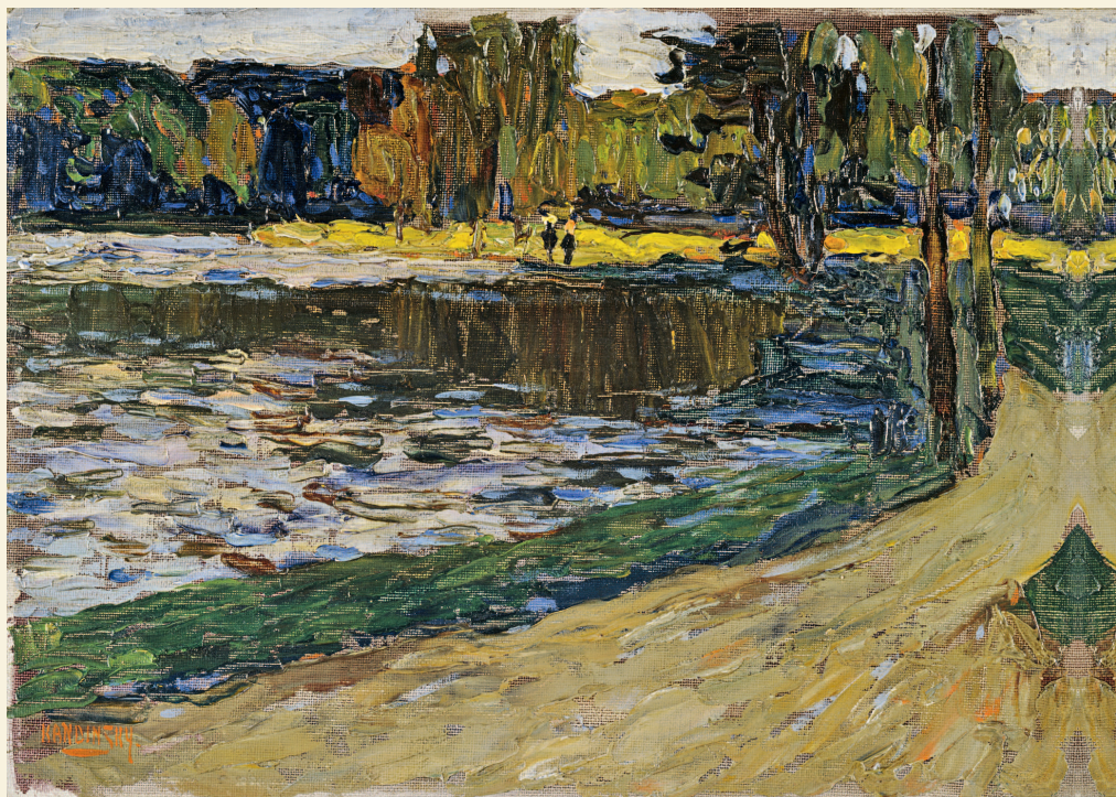
Василий Кандинский. Мюнхенский английский сад. 1901. Ленбаххаус, Мюнхен

В первой половине XIX века расцветает романтизм, основными темами которого стали сцены подвигов. В работах художники используют насыщенные цвета, соблюдая при этом строгое их расположение: на переднем плане — темные оттенки,