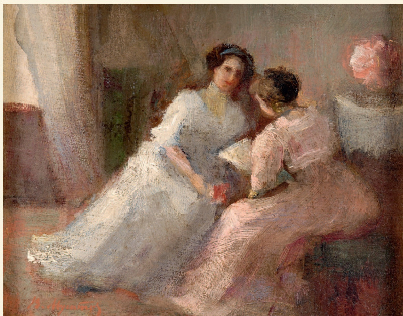
Виктор Борисов-Мусатов. Беседа. 1905. Частное собрание