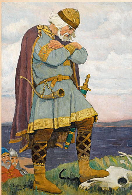
Виктор Васнецов. Вещий Олег. 1899. Частное собрание