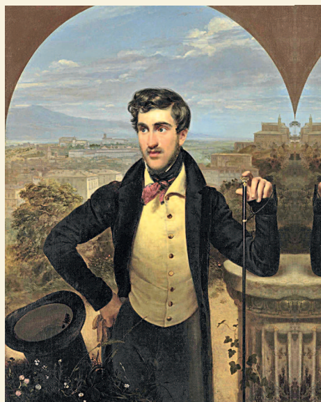
Орест Кипренский. Портрет князя Голицына. 1833. Частное собрание

Первые парсуны создавали мастера Оружейной палаты Московского Кремля в начале XVII века. Часто в жанре парсуны делали надгробные портреты; они почти не отличались от икон, так как их писали так же темперой по доске. Позже парсуна стала развиваться по двум направлениям. Первое было ближе к иконному образцу: черты реального человека стали как будто бы накладываться на